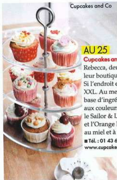
Cupcakes and Co