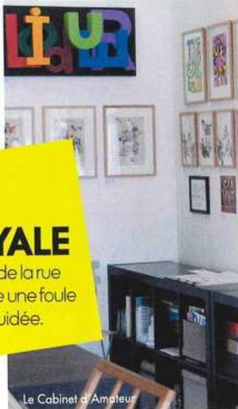
Le Cabinet d'Amateur

■ Tél. : 01 43 48 14 06. www.lecabinetdamateur.com